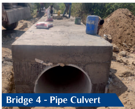
Bridge 4 - Pipe Culvert