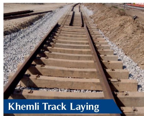
Khemli Track Laying