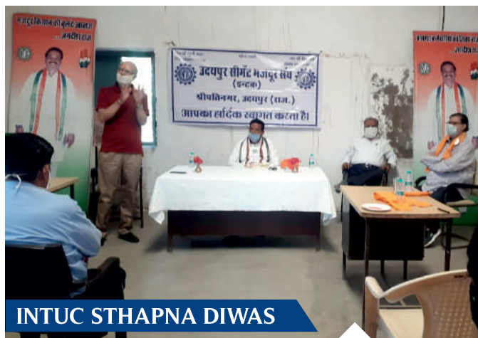
INTUC STHAPNA DIWAS